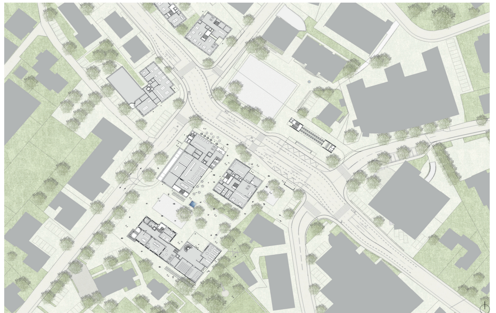
Situation mit Erdgeschoss

Alle Bauten sind sowohl funktional als auch architektonisch eigenständig konzipiert. Im Vordergrund steht die städtebauliche Strategie, nicht ein Gesamtprojekt. Dem Ort entsprechend sind es einzelne Bausteine, die zusammengefügt werden und über die Freiräume miteinander reagieren. Jeder Bau hat seine eigene Identität und interagiert mit dem Nachbarn. Damit können die verschiedenen Projekte sowohl organisatorisch, verfahrensmässig als auch in zeitlicher Hinsicht unabhängig voneinander realisiert werden.