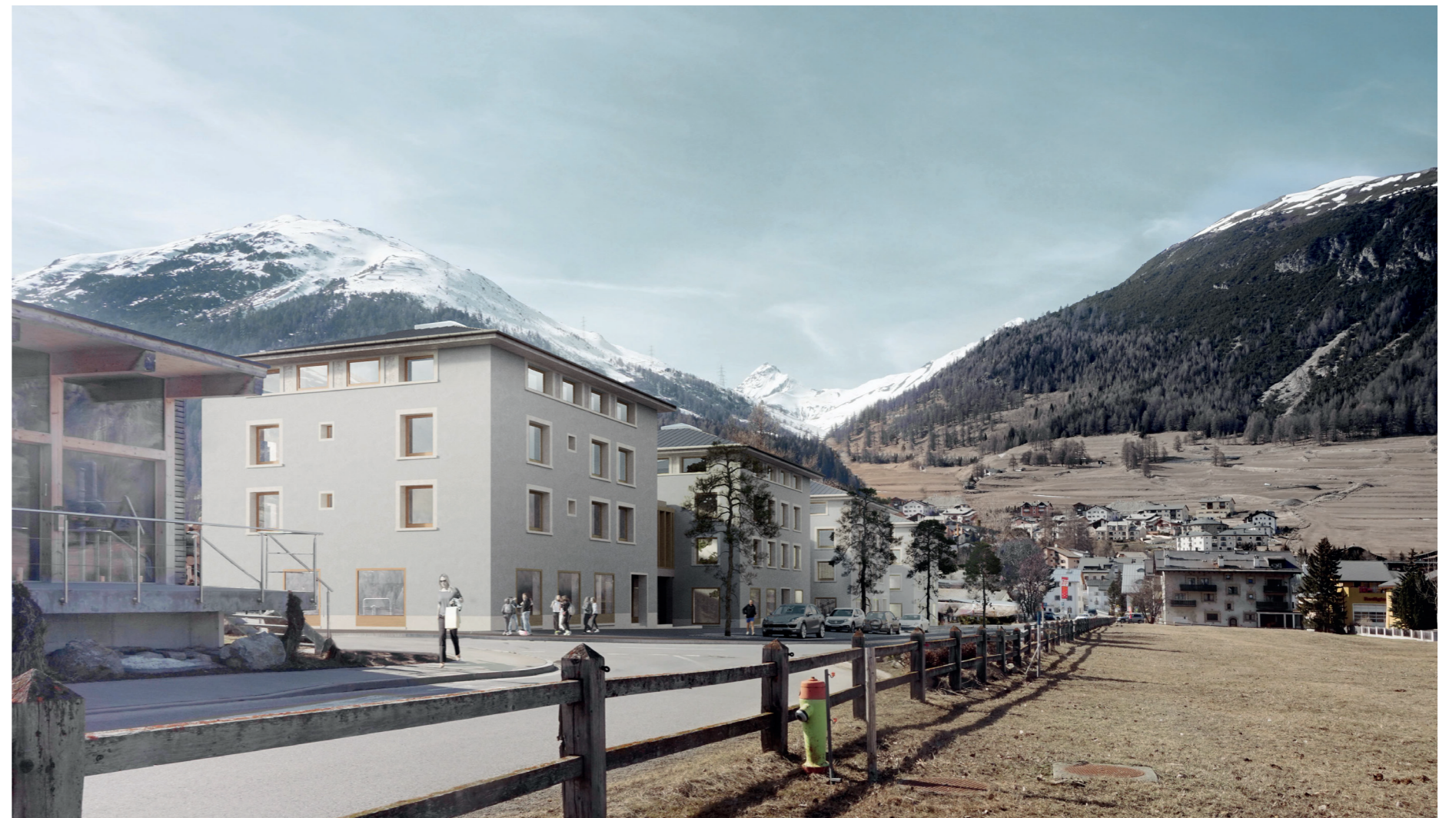
Visualisierung Blick von Via Cumünela

Auf der Basis des Konzepts des Architekturbüros Clerici Müller & Partner, St. Gallen wurde infolge ein Quartierplan erstellt. Der Quartierplan Truochs / La Resgia wurde 2014 beschlossen. Im Quartierplan wurden verschiedene Etappen festgelegt. Darauf basierend wurde für den gemeindeeigenen Teil ein Bauprojekt ausgearbeitet, beinhaltend Wohnungen für Einheimische, Gewerbeflächen und eine unterirdische TG.