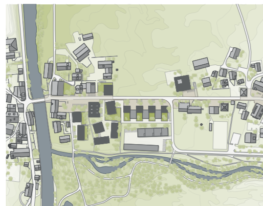
Situation im Siedlungsgebiet