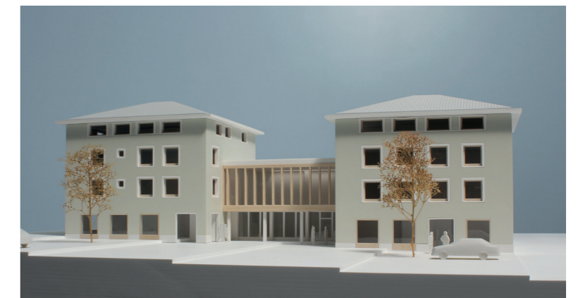
Modell Blick von der Via Cumünela