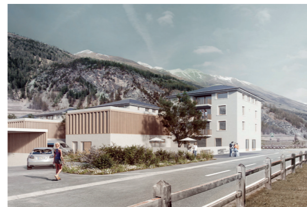
Visualisierung Blick von Südwest